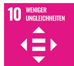
Ziel 10 der Sustainable Development Goals: Weniger Ungleichheiten.