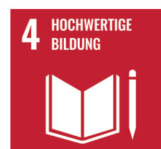
Ziel 4 der Sustainable Development Goals: Chancengerechte und hochwertige Bildung.

Mit unserem Karriereratgeber-Blog geben wir allen Bewerber*innen Tipps und Anregungen rund um die Themen Job und Karriere an die Hand.