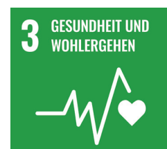
Ziel 3 der Sustainable Development Goals: Gesundheit und Wohlergehen.

In allen Standorten halten wir zudem kostenfreie Getränke für unsere Mitarbeiter bereit.