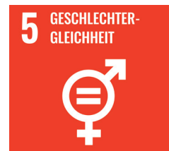
Ziel 5 der Sustainable Development Goals: Geschlechtergleichheit.

Auch der Krieg in der Ukraine hat eine Welle der Hilfsbereitschaft ausgelöst: Viele Niederlassungen haben eigeninitiativ Spenden und Sachgüter gesammelt, um diese an Hilfsorganisationen weiterzugeben.