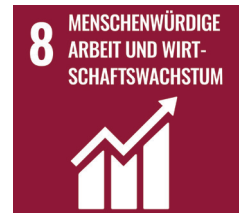
Ziel 8 der Sustainable Development Goals: Gute Arbeit und Wirtschaftswachstum.