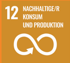
Ziel 12 der Sustainable Development Goals: Nachhaltiger Konsum und Produktion.

Beim Versand der Werbemittel an unsere bundesweiten Standorte wird darauf geachtet, möglichst wenig Verpackungen zu nutzen. Mit der Festlegung auf einen Versandtag pro Woche ist zudem sichergestellt, dass Bestellungen möglichst gebündelt rausgehen.