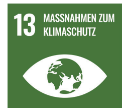
Ziel 13 der Sustainable Development Goals: Klimaschutz und Anpassung

Die CO 2 -Emissionen haben 2020 und 2021 im Vergleich zu 2019 stark abgenommen. Ein ausschlaggebender Faktor hierfür war die Umstellung auf Ökostrom. Allerdings sind die deutlich geringeren Emissionswerte auch auf die Covid-19 Pandemie zurückzuführen.